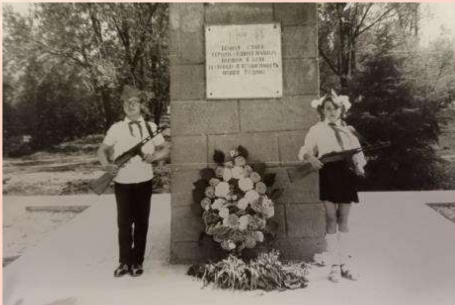
Моя мама в почетном карауле