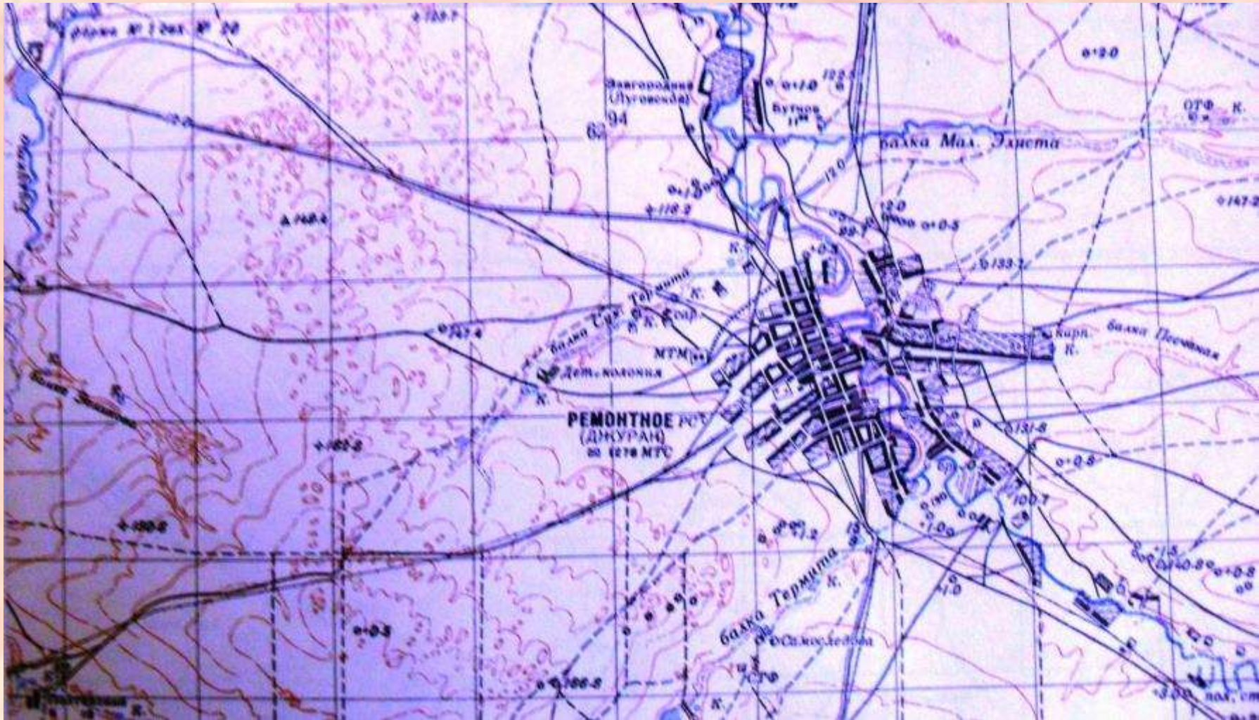
Расположение детской колонии на карте