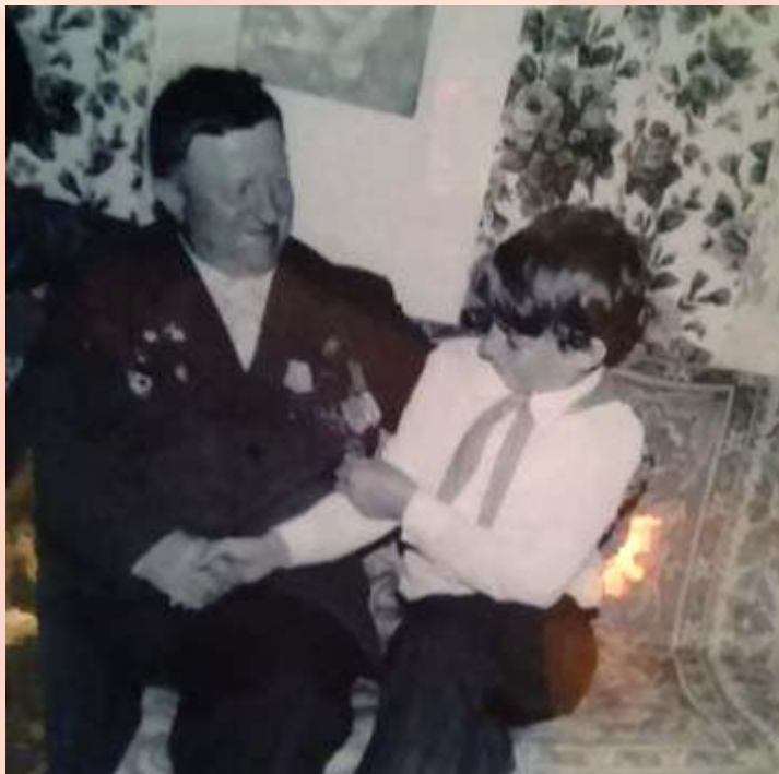
Встреча с ветераном